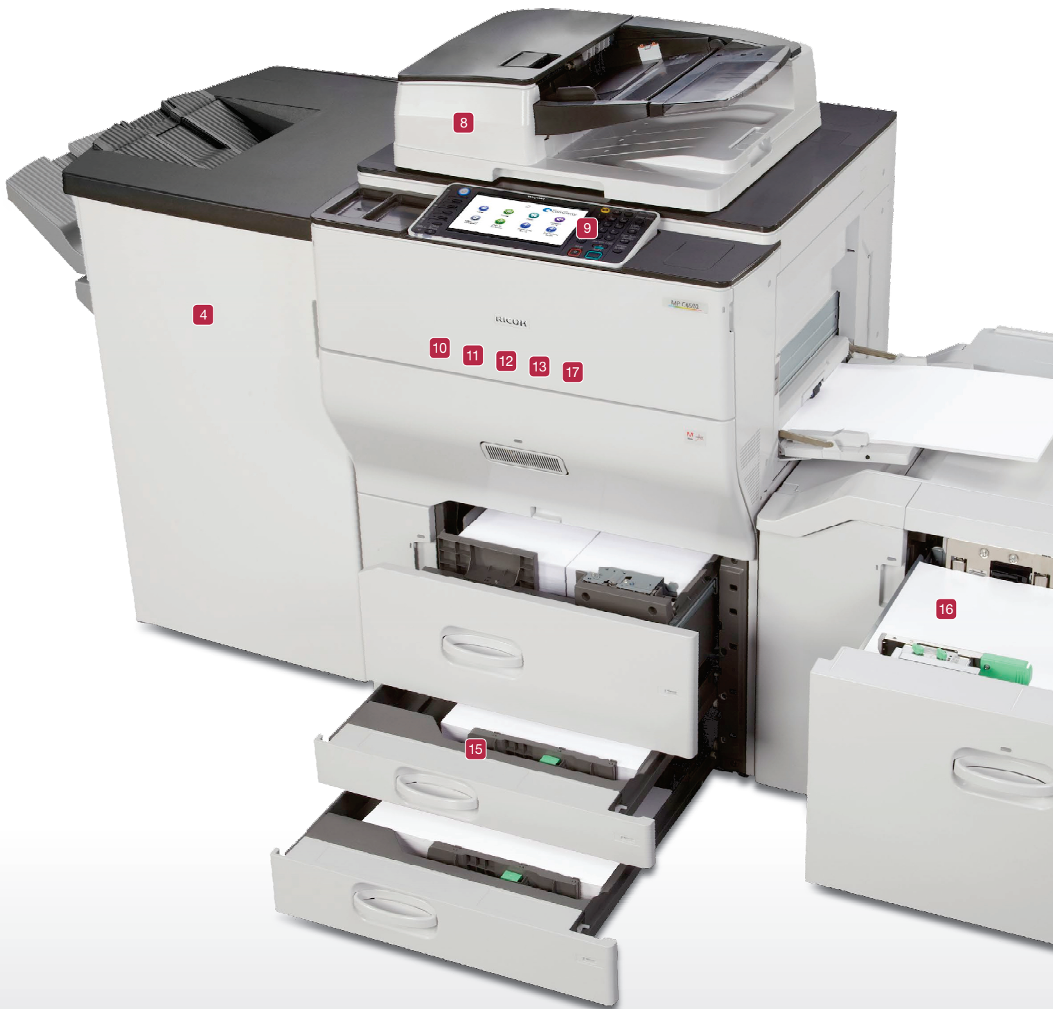
Ricoh MP C6502/MP C8002